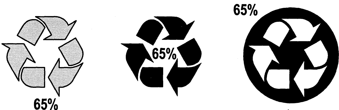
Hình 2 - Các ví dụ về vị trí chấp nhận được của giá trị phần trăm hàm lượng được tái chế khi sử dụng với vòng Mobius

7.8.3.5 Một biểu tượng khi được sử dụng có thể được kèm theo định danh nguyên vật liệu.