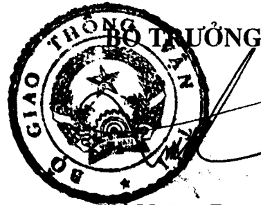
Hộ Nghĩa Dũng