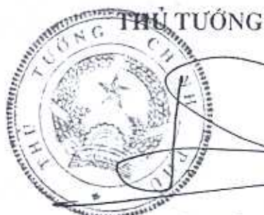
Nguyễn Tấn Dũng