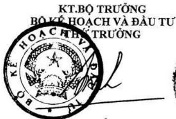
Cao Việt Sinh