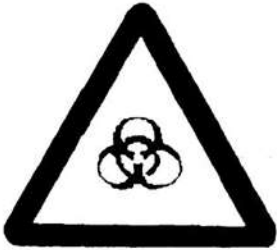
Biểu tượng chất thải nguy hại