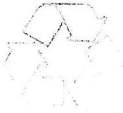
Biểu tượng chỉ chất thải tái chế được