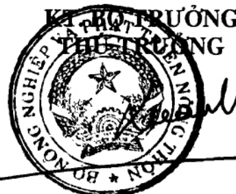
Hồ Xuân Hùng