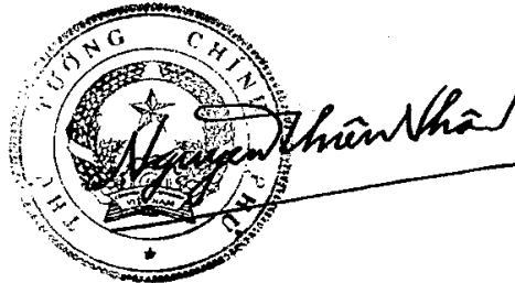
Nguyễn Thiện Nhân