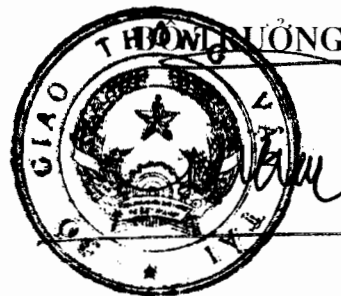
Dinh La Thăng