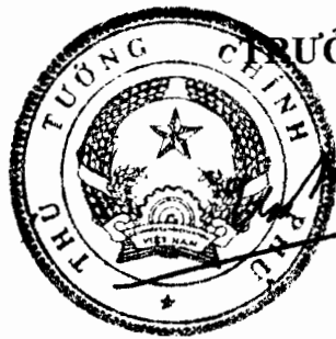
PHÓ THỦ TƯỚNG Vũ Văn Ninh

Việc sửa đổi, bổ sung Quy chế này do Trưởng ban Ban Chỉ đạo quyết định trên cơ sở đề nghị của Cơ quan thường trực và các ủy viên Ban Chỉ đạo./.