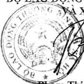
Phạm Thị Hải Chuyên

BỘ TRƯỞNG BỘ LAO ĐỘNG - THƯƠNG BINH VÀ XÃ HỘI