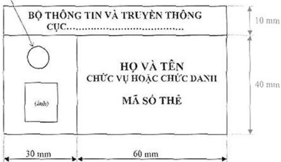
Hình 2: Mặt sau của thẻ công chức thanh tra