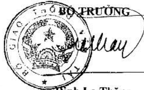
Đinh La Thăng