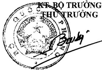
Thượng tướng Đỗ Bá Ty