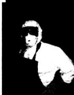
Bộ quần áo kín có kèm áo ni lông phía trước, phù hợp cho lấy mẫu gia cầm tại thực địa.