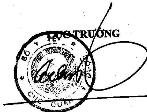
Trương Quốc Cường