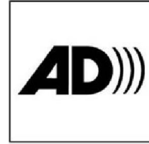
Có thuyết minh