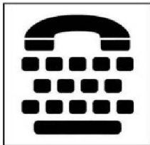
Điện thoại có bàn phím chữ