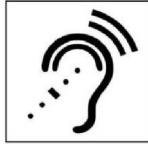
Thiết bị trợ thính