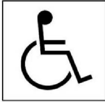
Biểu tượng đảm bảo tiếp cận quốc tế