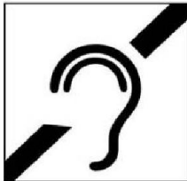
Người khiếm thính