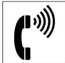
Điện thoại có điều chỉnh âm lượng nghe