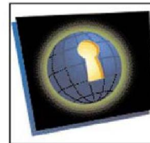
Tiếp cận Web