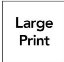
Bản in cỡ to