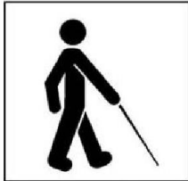
Người khiếm thị