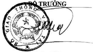
Đinh La Thăng