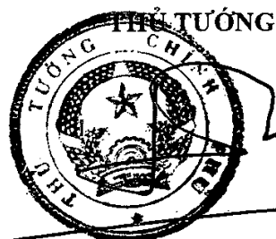
Nguyễn Tấn Dũng