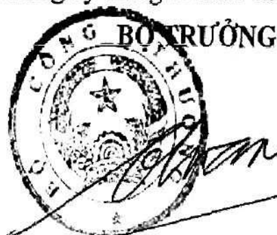
Vũ Huy Hoàng

5. Trước ngày 20 tháng 11 năm 2015 các cơ quan, đơn vị, các Sở Công Thương và doanh nghiệp nêu tại điểm 1 và 2 trên đây tổ chức kiểm điểm đánh giá kết quả thực hiện chương trình và báo cáo về Bộ (Vụ Kế hoạch) để tổng hợp báo cáo Chính phủ trong phiên họp thường kỳ tháng 12 năm 2015. / ll