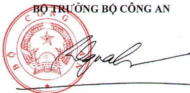
Đại tướng Trần Đại Quang

Trong quá trình thực hiện, nếu có khó khăn, vướng mắc, các tổ chức, cá nhân báo cáo về Bộ Nông nghiệp và Phát triển nông thôn (qua Tổng cục Thủy sản) và Bộ Công an (qua Tổng cục Cảnh sát) để kịp thời hướng dẫn./. Đ