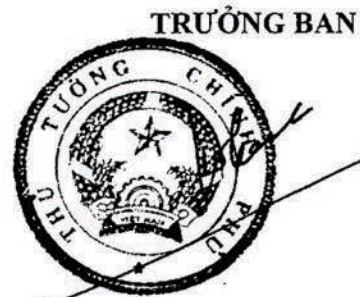
PHÓ THỦ TƯỚNG Nguyễn Xuân Phúc