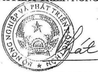
Cao Đức Phát

BỘ TRƯỞNG BỘ NÔNG NGHIỆP VÀ PHÁT TRIỂN NÔNG THÔN