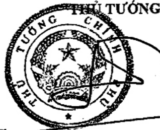
Nguyễn Tấn Dũng

Đối với các hoạt động phải triển khai trong năm 2015, các Bộ, cơ quan ngang Bộ, cơ quan thuộc Chính phủ, các cơ quan liên quan và các địa phương được phân công thực hiện có trách nhiệm dự toán bổ sung và sắp xếp, bố trí trong dự toán ngân sách năm 2015 để triển khai thực hiện./