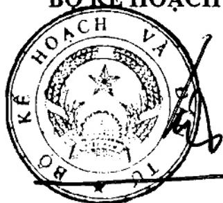
Bùi Quang Vinh