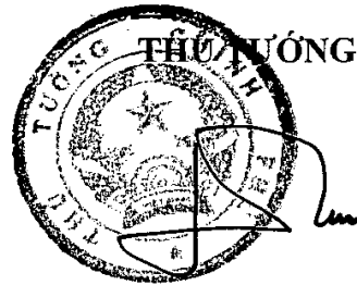
Nguyễn Tấn Dũng