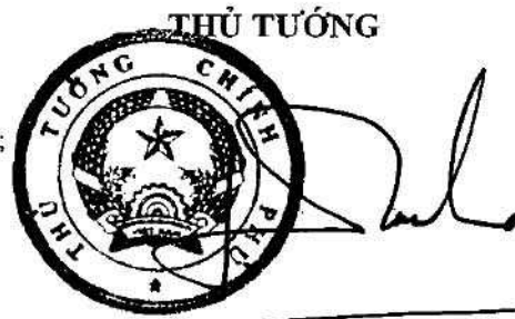
Nguyễn Tấn Dũng