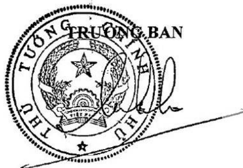
PHÓ THỦ TƯỚNG Trương Hòa Bình