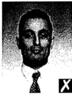
too far away