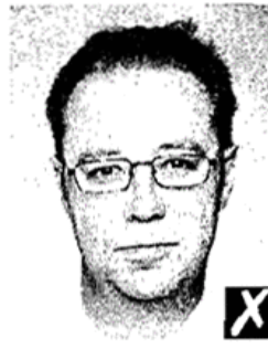
unnatural skin tones