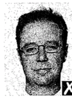
washed out colour