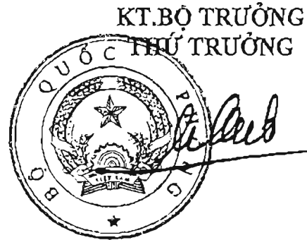
Trung tướng Phan Văn Giang