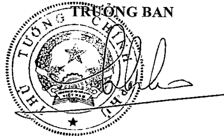
PHÓ THỦ TƯỚNG Trương Hòa Bình

- Chủ động đề xuất với Trưởng Ban Chỉ đạo và Bộ Nội vụ về những nhiệm vụ trọng tâm cải cách hành chính thuộc phạm vi quản lý nhà nước của bộ, cơ quan ngang bộ cần có sự phối hợp, đôn đốc từ Ban Chỉ đạo; tập trung đổi mới công tác chỉ đạo, điều hành, tăng cường trách nhiệm, đề xuất sáng kiến cải cách hành chính./