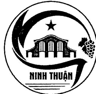
Hình 2. Mẫu in đen trắng