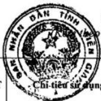
Bảng 1: Phân bổ các chỉ tiêu Kế hoạch sử dụng đất năm 2018 huyện Kiên Lương Quyết định số: 797/QĐ-UBND ngày 06 tháng 4 năm 2018 của Ủy ban nhân dân tỉnh Kiên Giang