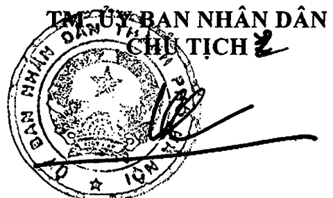
Nguyễn Đức Chung