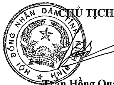
Trần Hồng Quảng

Trong quá trình thực hiện, nếu có khó khăn, vướng mắc, các cơ quan, đơn vị, tổ chức, các nhân phản ánh về Ủy ban nhân dân tỉnh để tổng hợp trình Hội đồng nhân dân tỉnh sửa đổi, bổ sung kịp thời./.