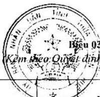
Biểu 03. Dự toán kinh phí đầu tư theo nguồn vốn giai đoạn 2018-2025 Căn theo Quyết định số 1889/QĐ-UBND ngày 25/8/2018 của UBND tỉnh Thừa Thiên Huế)