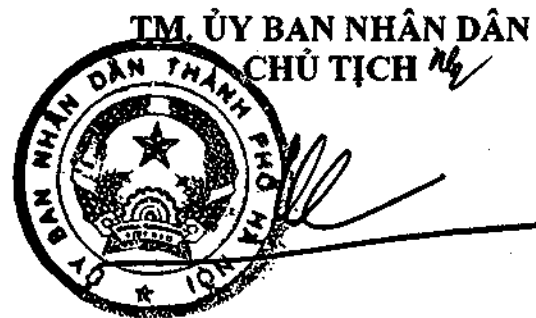
Nguyễn Đức Chung