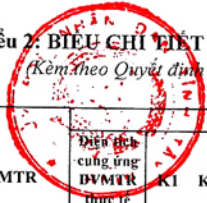
Biểu 2: BIỂU CHI TIẾT CHI TRẢ TIỀN DỊCH VỤ MÔI TRƯỜNG RỪNG NĂM 2019 TỈNH TÂY NINH (Kèm theo Quyết định số 1308/QĐ-UBND, ngày 30 tháng 6 năm 2019 của Chủ tịch UBND tỉnh Tây Ninh)