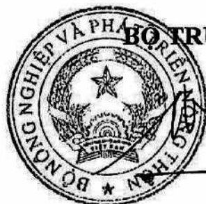
Nguyễn Xuân Cường

3. Giao Vụ Kế hoạch chủ trì, phối hợp với Văn phòng Bộ, Đảng ủy Bộ, Đảng ủy Khối cơ sở Bộ Nông nghiệp và PTNT tại Thành phố Hồ Chí Minh theo dõi và báo cáo kết quả thực hiện của các cơ quan, đơn vị./.