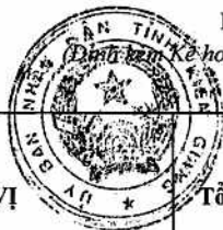
Biểu 2: Tổng hợp kinh phí sự nghiệp đào tạo

Kế hoạch số 142 /KH-UBND ngày 06 /10/2017 của UBND tỉnh Kiên Giang)