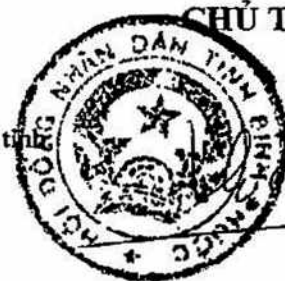
Trần Tuệ Hiền