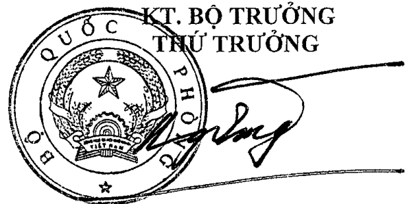
Thượng tướng Bế Xuân Trường