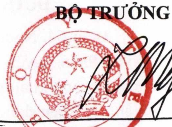
Nguyễn Thanh Long