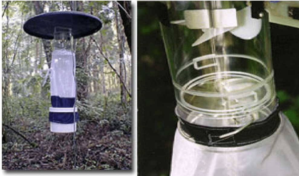
Bẫy đèn CDC

Bẫy đèn: bẫy đèn bắt muỗi có nhiều loại khác nhau: loại dùng nguồn điện 220V; loại khác dùng ắc quy hoặc dùng pin khô thích hợp để bắt muỗi ở những vùng xa xôi, hẻo lánh chưa có điện lưới... cấu tạo của các loại bẫy đèn gồm 5 bộ phận chính: chao bẫy, thân bẫy, nguồn sáng, cánh quạt cùng mô tơ, và lồng đựng muỗi.