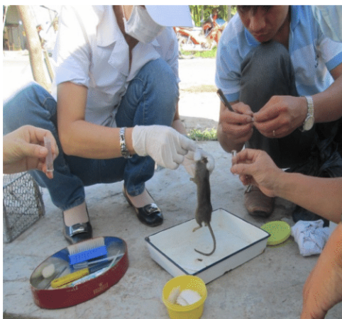
Thu thập bộ chết ở chuột