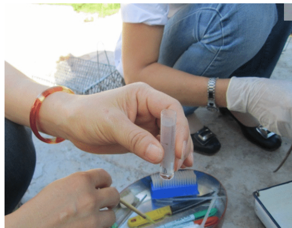
Thu thập và bảo quản mẫu bộ chết vào tuýp chứa cồn 70 0