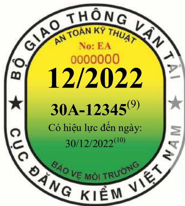
Tem kiểm định dùng cho xe kinh doanh vận tải