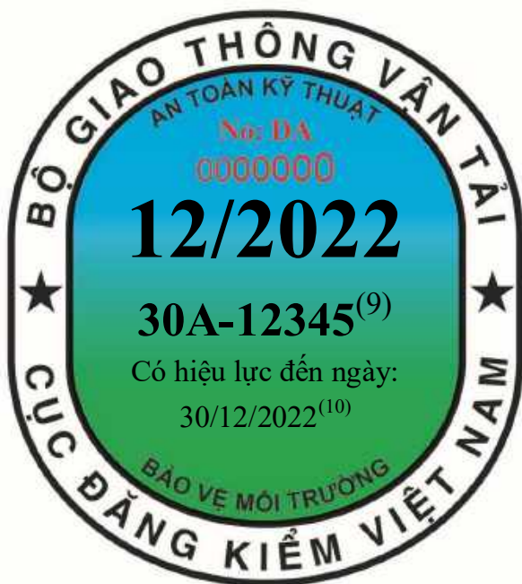
Tem kiểm định dùng cho xe không kinh doanh vận tải