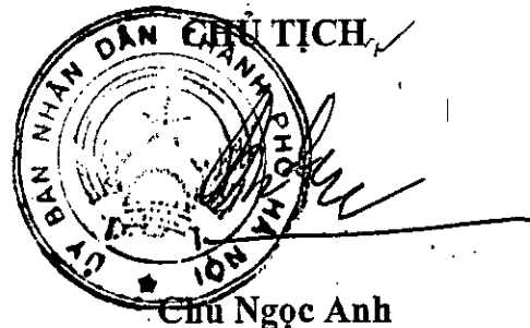
Chu Ngọc Anh