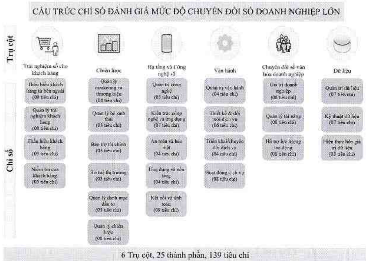
Hình 2. Cấu trúc Chỉ số đánh giá mức độ chuyển đổi số doanh nghiệp lớn

Chỉ số đánh giá mức độ chuyển đổi số doanh nghiệp lớn được cấu trúc theo 06 trụ cột (pillar) gồm: (1) Trải nghiệm số cho khách hàng, (2) Chiến lược, (3) Hạ tầng và công nghệ số, (4) Vận hành, (5) Chuyển đổi số văn hóa doanh nghiệp, và (6) Dữ liệu và tài sản thông tin. Trong mỗi trụ cột có các chỉ số thành phần, trong mỗi chỉ số thành phần có các tiêu chí (25 chỉ số thành phần và 139 tiêu chí). Sơ đồ cấu trúc Chỉ số đánh giá mức độ chuyển đổi số doanh nghiệp lớn được mô tả như Hình 2.