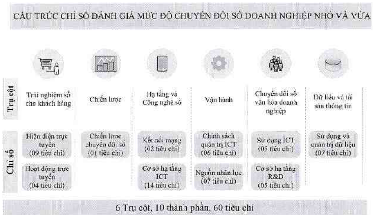
Hình 1. Cấu trúc Chỉ số đánh giá mức độ chuyển đổi số doanh nghiệp nhỏ và vừa

Trong mỗi trụ cột có các chỉ số thành phần, trong mỗi chỉ số thành phần có các tiêu chí (10 chỉ số thành phần và 60 tiêu chí). Sơ đồ cấu trúc Chỉ số đánh giá mức độ chuyển đổi số doanh nghiệp nhỏ và vừa được mô tả như Hình 1.