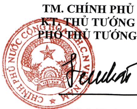
Lê Minh Khái